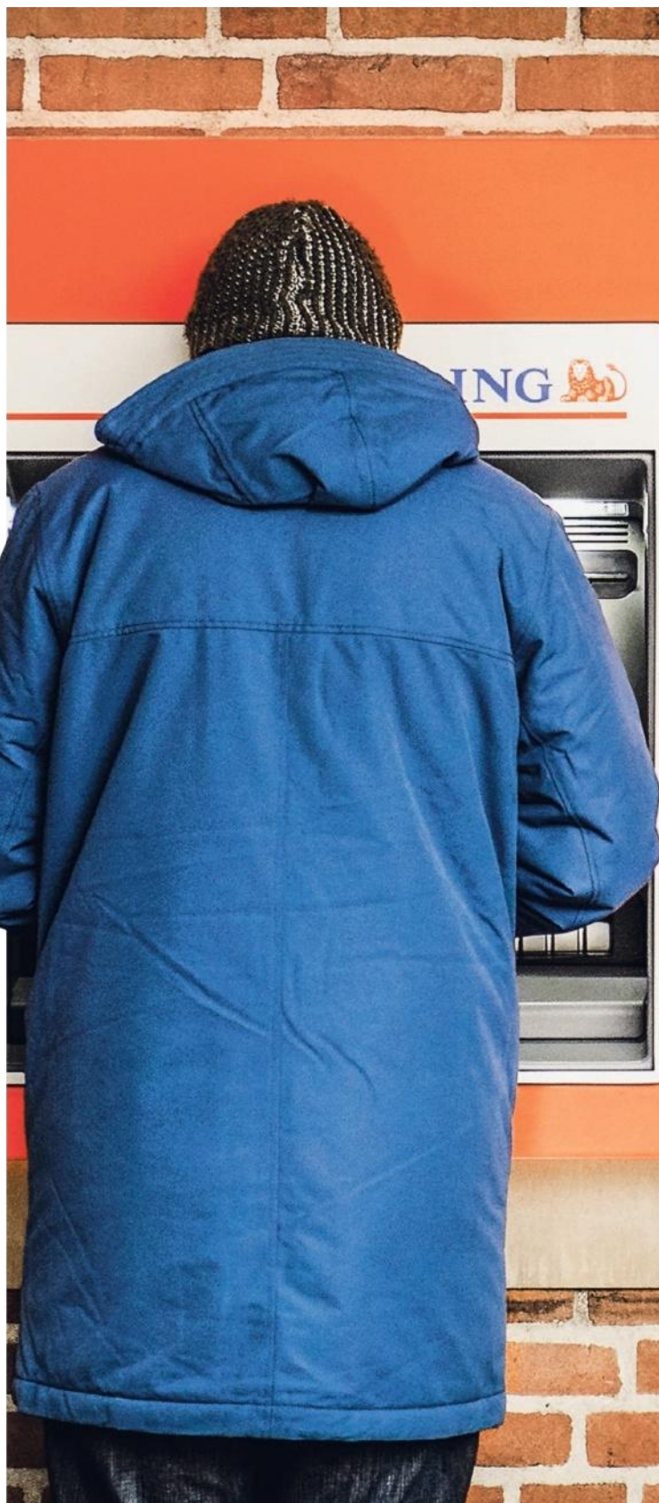
Vorig jaar werd in winkels voor het eerst meer gepind dan contant betaald.

In dat land is dankzij allerlei digitale initiatieven inmiddels is nog maar 20 procent van de winkelbeta-