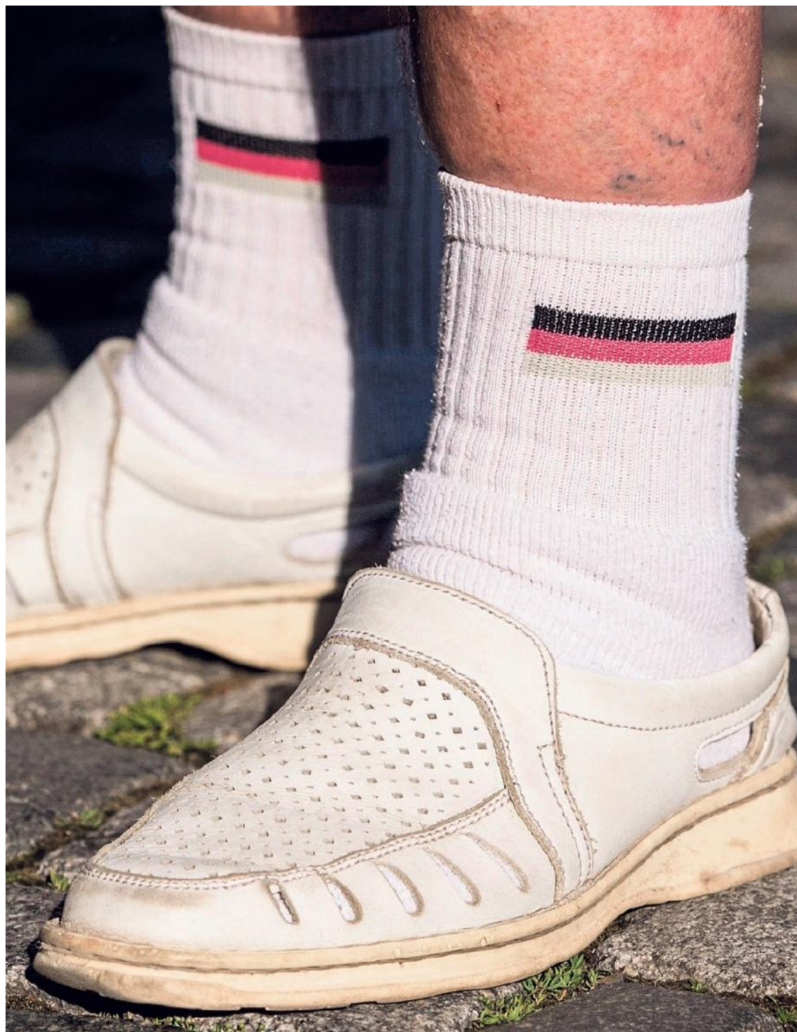
Sokken van een Pegida-aanhanger bij een demonstratie. Volgens het IMF belemmert populisme de economische groei.

De onrust rond Deutsche Bank vorige week, de bank die eerder door het IMF al werd getypeerd als een 'risico voor het financiële systeem', komt volgens de onderzoekers niet zozeer door de miljardenboete van het Amerikaanse ministerie van Justitie die de bank boven het hoofd hangt. Dattels zei dat onvoldoende winstgevendheid de onderliggende oorzaak is, en verwees naar het feit dat de banksector in zijn geheel op de beurzen minder waard is dan de boekwaarde. „Beleggers verleggen hun aandacht van de solvabiliteit van banken naar de winstgevendheid van banken in de toekomst.” Amerikaanse banken hebben nog steeds veel meer