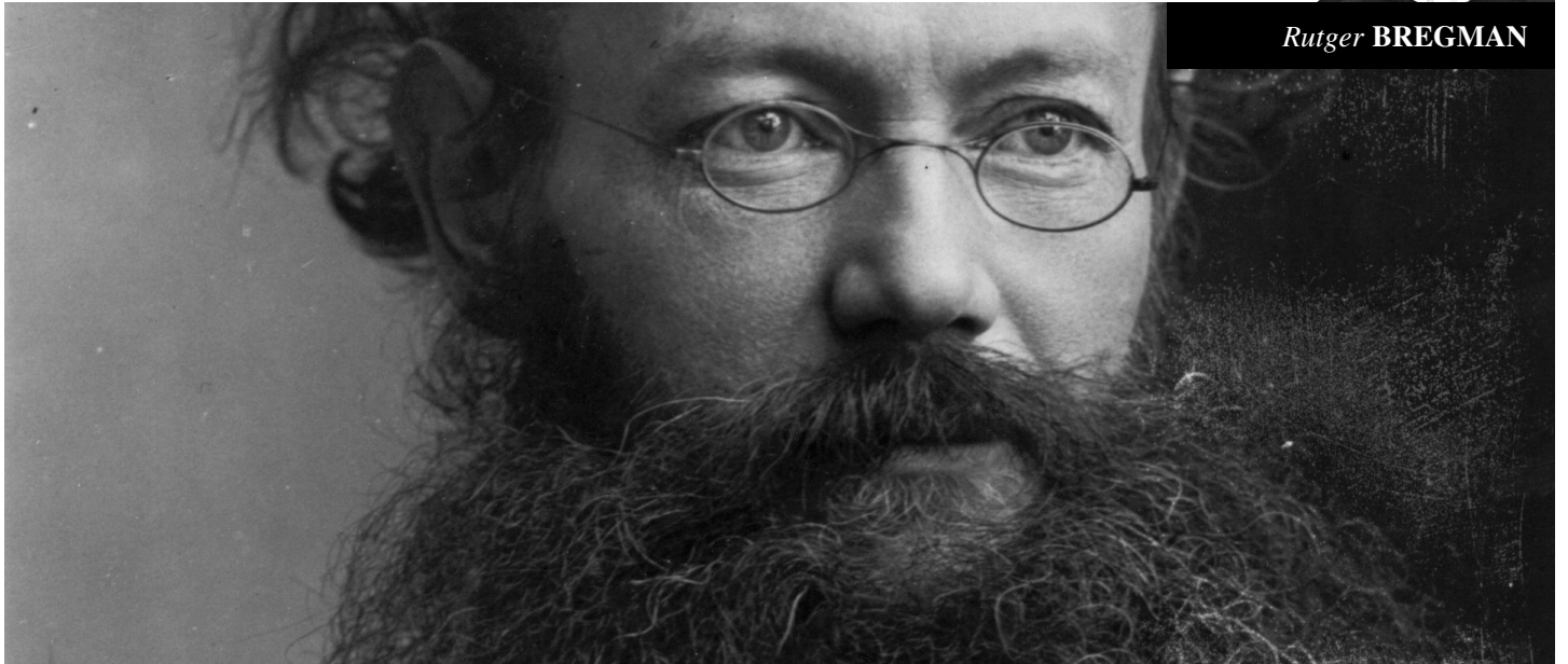
Peter Aleksejevitj Kropotkin.