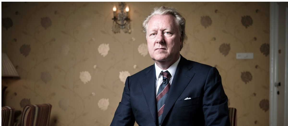
Erwin de Ruiter

bepaald niet beter van: forensisch onderzoekers, advocaten, rechtszaken, hij betaalde ze allemaal uit eigen zak. Zijn kosten moeten in de tonnen lopen. Toch zet Van Doorn door. ‘Ik heb een lange reeks waarschuwingen aan ING gedaan. Maar in plaats van die waarschuwingen serieus te nemen, heeft de bank er alles aan gedaan om de fraude af te dekken. Alles is de doofpot in gegaan.’