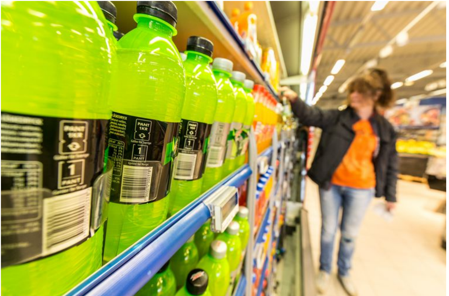
▲ Plastic flessen bij de Rema 1000.

Noorwegen noemt zich met trots 'wereldkampioen inzamelen'. Liefst 95 procent van alle blikjes en frisdrankflessen en -flesjes komen weer retour. Dankzij statiegeld en een milieuheffing.