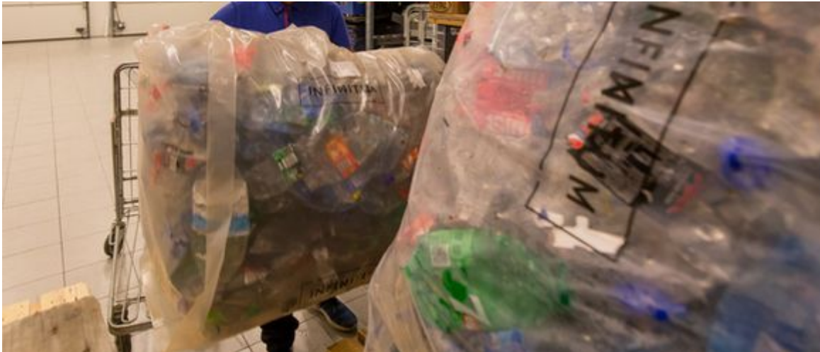
Een Rema-medewerker voert flessen af die geplet uit de retourmachine komen.

Lege blikjes en flesjes worden weer meegenomen in de vrachtwagens die supermarkten van nieuwe goederen voorzien. De blikjes worden gesmolten en het aluminium verkocht aan bedrijven die er weer blikjes van maken. De PET-flessen worden gewassen, gedroogd en vermalen en het granulaat als grondstof verhandeld. Hoe hoger die inkomsten, hoe goedkoper het inzamelsysteem.