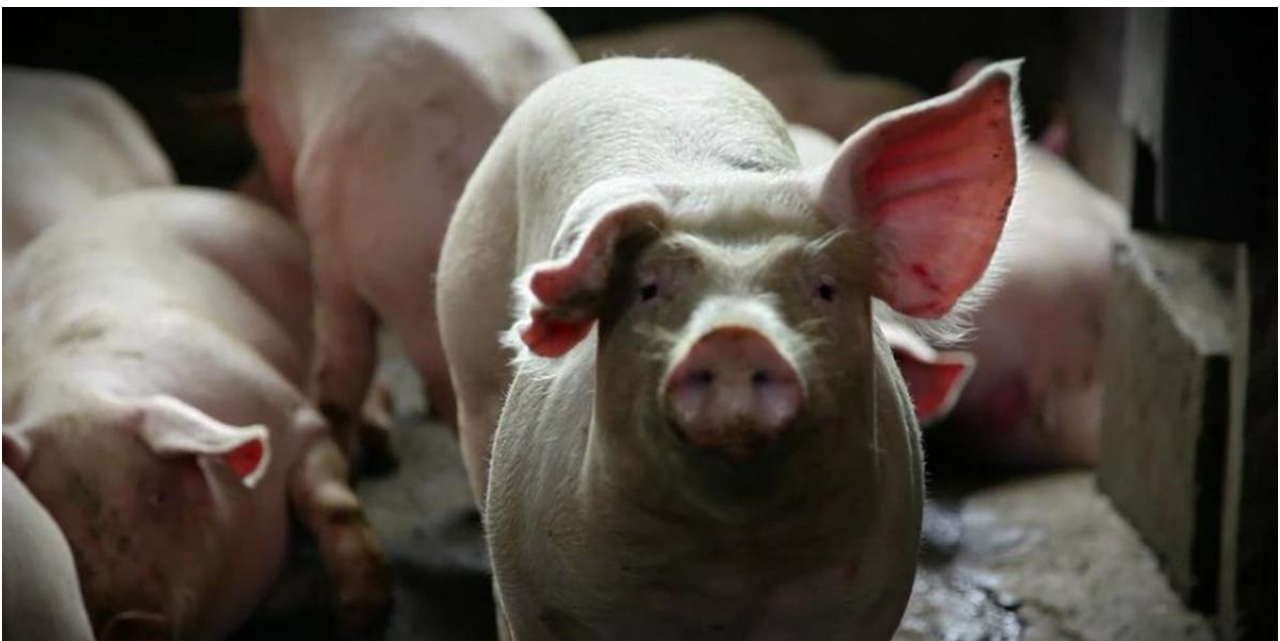
Animal Rights Australia

In Vlaanderen hebben de landbouworganisaties de neiging om de link tussen veeteelt en klimaatverandering niet zozeer te banaliseren dan wel te minimaliseren. Wie de cijfers en taartdiagrammen bekijkt, kan blijkbaar niet anders dan besluiten dat de tien procent van de uitstoot waar de landbouwsector voor verantwoordelijk is, niet het voornaamste probleem is. Bovendien wijst de sector er graag op dat ze er tegenover 1990 al in slaagde haar aandeel in het broeikasgastotaal met meer dan twintig procent te verminderen. Wat deze cijfers niet vertellen, is dat veel van onze uitstoot zich in het buitenland bevindt en dat tegenover het aandeel van 0,4 procent dat de landbouw heeft in de algehele economische activiteit, tien procent uitstoot aanzienlijk is.