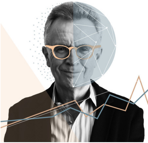
Illustratie: Hannah Kay Piché

is, kan hij de woorden van zijn vader niet meer navertellen. Het was iets beledigends, dat weet hij wel. Iets stoms, iets vreselijks. Maar Ravallion voelt zich trots. Twee dagen later valt de cheque in de bus.