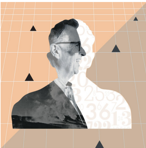
Illustratie: Hannah Kay Piché

Even overweegt hij te stoppen met zijn opleiding, maar dan komt er een keerpunt. In zijn tweede studiejaar overtuigt hij zijn leraren om - samen met twee bevriende studenten - een jaar lang het Australische provinciestedje Yass te bestuderen.