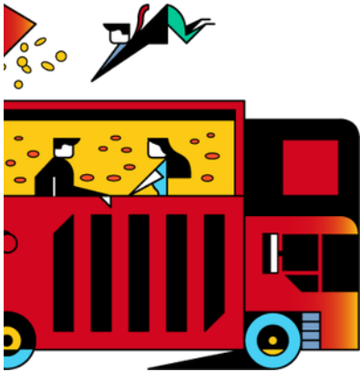
Illustratie: Maus Bullhorst (voor correspondent)

hebben we het hier over een ouderwets advertentiebedrijf. Vorig jaar ging maar liefst 64 procent van alle online-advertentie-inkomsten in de VS naar Google en Facebook.