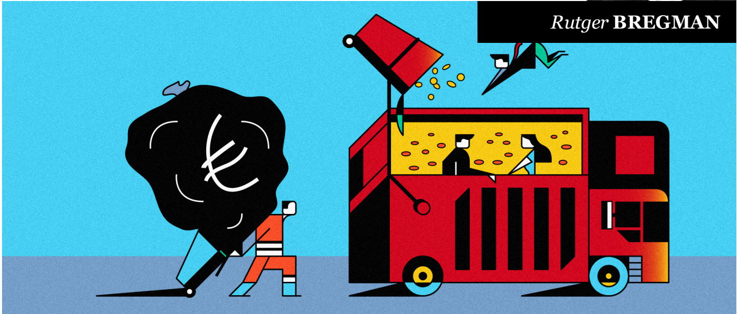
Illustratie: Maus Bullhorst (voor De Correspondent)

‘ D e hardwerkende Nederlander, wie is dat eigenlijk? Wie bedoelt u?’