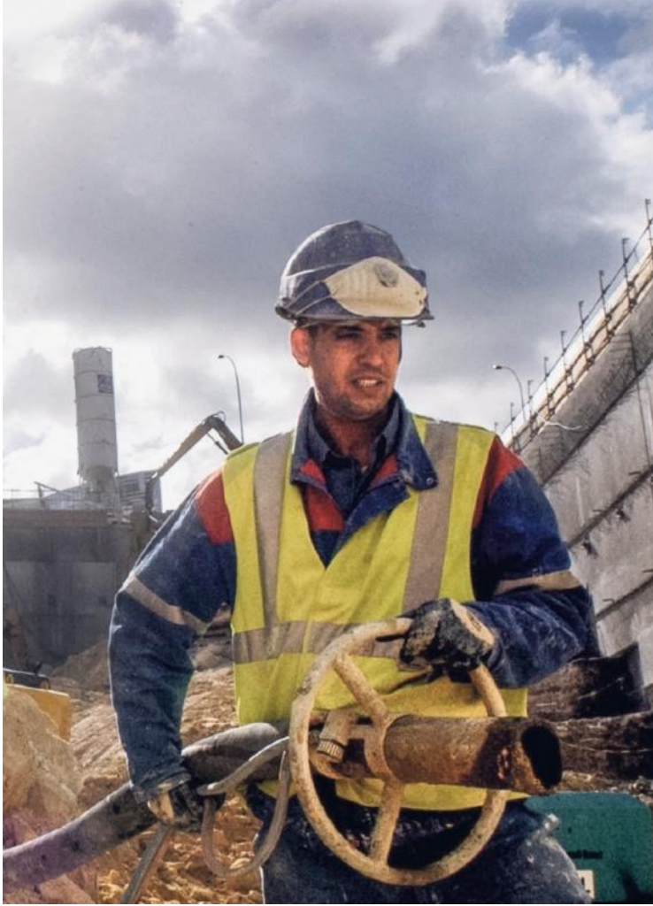
Bouwbedrijf Vinci onderzoekt nu de mogelijke juridische stappen.

misschien wel de eenvoudigste manier om de koers van een bedrijf omhoog of omlaag te jagen. De verspreider van het nepnieuws kan veel geld verdienen door op het juiste moment aandelen te kopen en te verkopen.