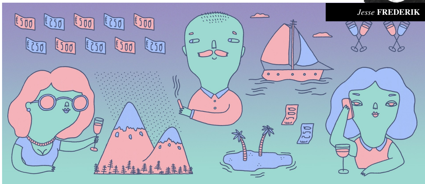
Illustratie: Doeke van Nuil (voor De Correspondent)