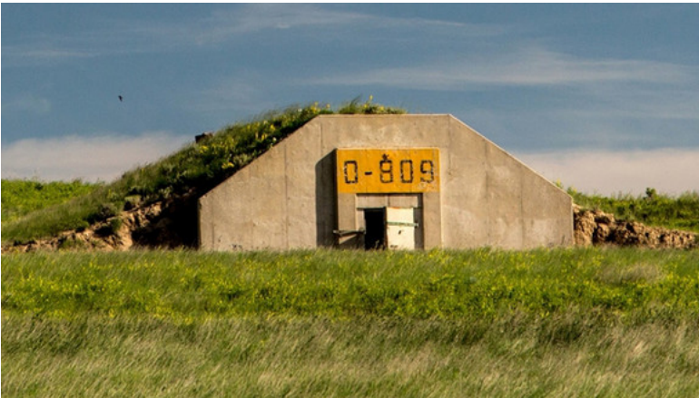
Een bunker van vivos

dodelijk virus of een asteroïde die op de aarde knalt. De miljardairs uit San Francisco vrezen naast de natuur vooral ook hun medemens.