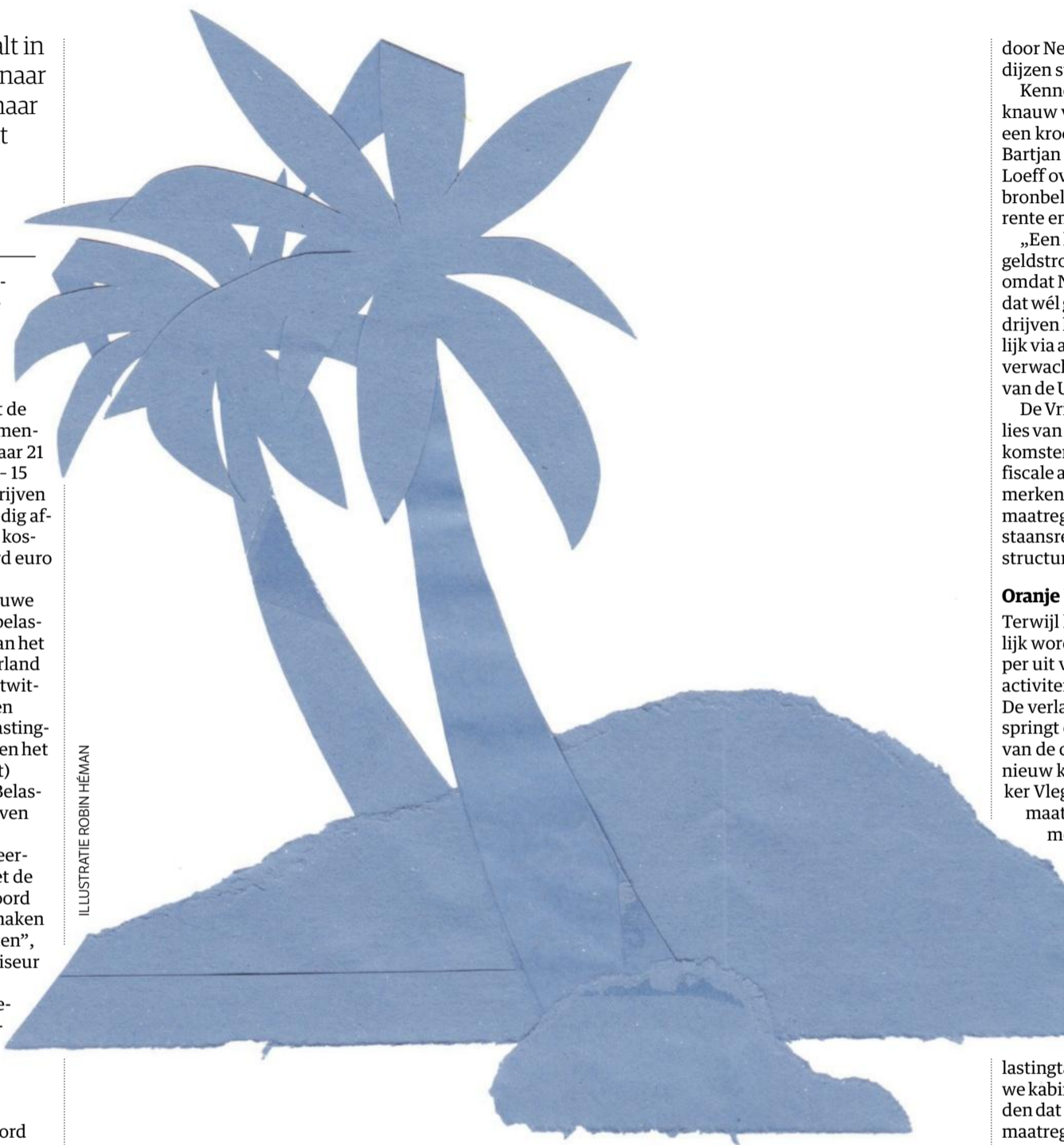
ILLUSTRATIE ROBIN HÉMAN

In de internationale strijd tegen belastingontwijking gaat Nederland voortaan „zelf het goede voorbeeld geven” door royalties en rente die