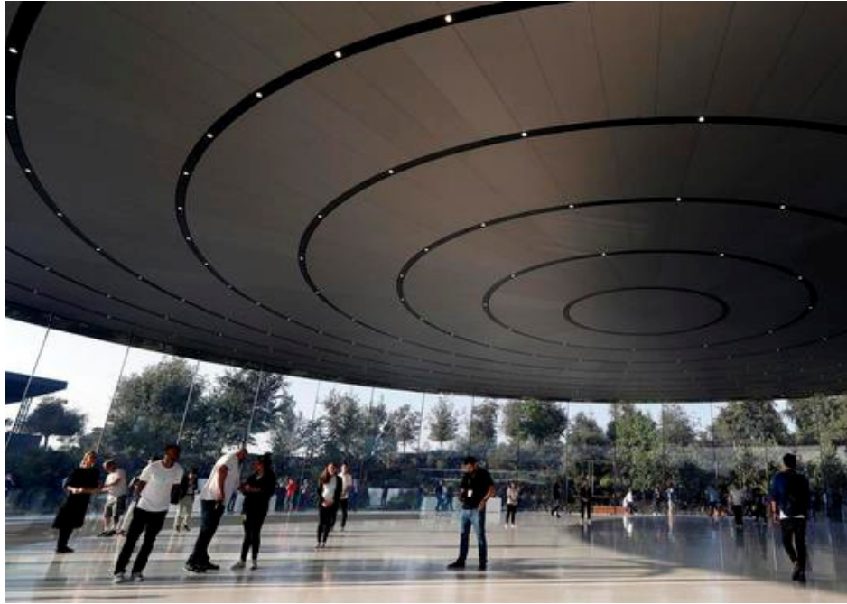
Het Steve Jobs Theater op de campus van Apple, in de stad Cupertino in de Amerikaanse staat Californië.