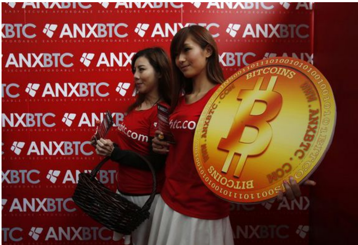
In de eerste bitcoinwinkel, in Hongkong.