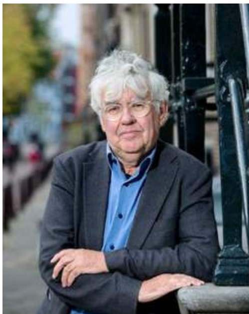
Geert Mak, schrijver van onder andere 'In Europa'.

"Ik weet het niet. In plaats van het optimisme van een New Deal is er een sfeer van zurigheid. Roosevelt nam in crisistijden iedereen mee, in het huidige Europa zijn tegenstellingen vergroot. Spanje en Portugal werden bijvoorbeeld zonder nadenken in hetzelfde naar knoflook ruikende mandje gegooid als Griekenland, terwijl het om andersoortige gevallen ging. Griekenland had een te hoge