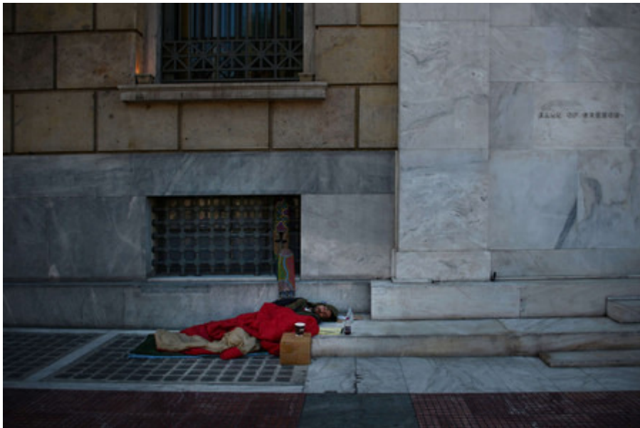
Daklozen in Athene.

Het duurt nog steeds bijna 4,5 jaar om bij een Griekse rechtbank een contract af te dwingen . Lees hier meer over de trage Griekse rechtsgang . Lees hier meer over de trage Griekse rechtsgang . een contract af te dwingen. In Nederland gaat dat ongeveer drie keer sneller. Het aantal rechtszaken loopt fors op, maar Griekse rechtbanken hebben door bezuinigingen steeds minder budget.