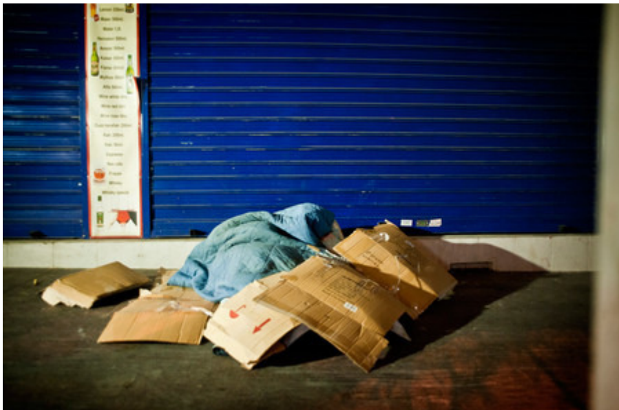
Daklozen in Athene.

Het schrijnende probleem van belastingontduiking is verre van opgelost. Toegegeven, er is heel wat hervormd: de Griekse belastingdienst is onafhankelijker gemaakt van de politiek, er is meer centrale aansturing en er zijn concretere doelstellingen voor inspecteurs. Dat is positief.