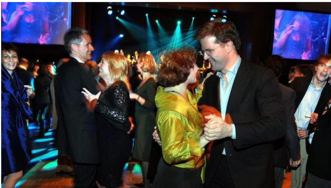
Schippers danst met premier Rutte.

Tussen partijleider Rutte en zijn vice-fractievoorzitter Schippers bestaan echter wel duidelijke ideologische verschillen. Hij is afkomstig uit de linkervleugel van de partij en staat een sociaal-liberale koers voor. Haar opvattingen zijn duidelijk rechtser, en verraden duidelijk de invloed van de jaren die ze heeft doorgebracht als belangenbehartiger van de werkgevers en als lid van de werkgroep ziektenkostenverzekeringen binnen de SER. Rutte droomt als staatssecretaris nog hardop over een fusie met D66, Schippers omschrijft dat als haar 'worst nightmare' .