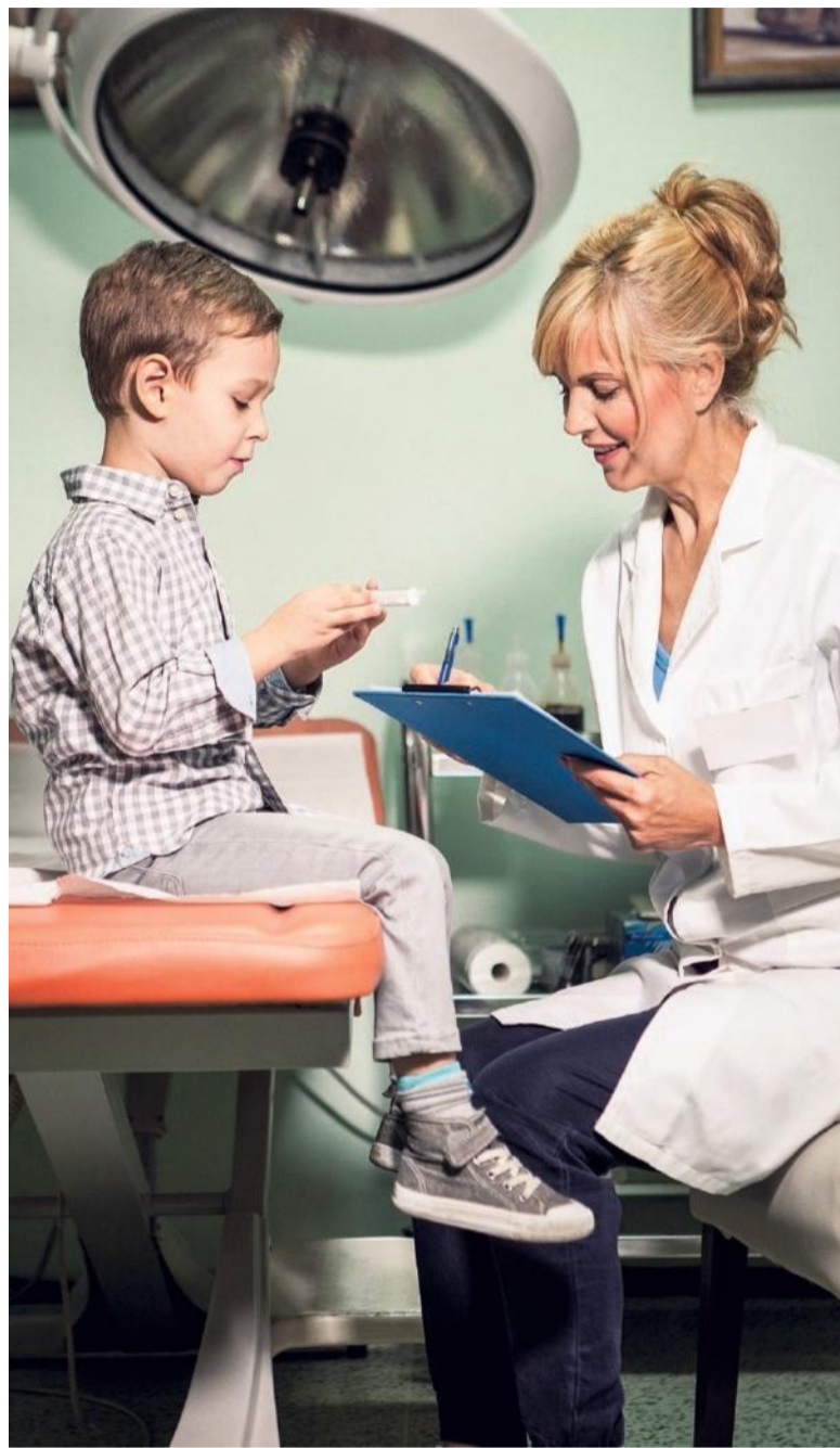
Niet zorgverzekeraars zijn machtig, maar huisartsen, zegt Gupta Strategists.

Met deze criteria komt Gupta met conclusies die haaks staan op aannames in het publieke debat. Niet zorgverzekeraars zijn machtig, maar juist