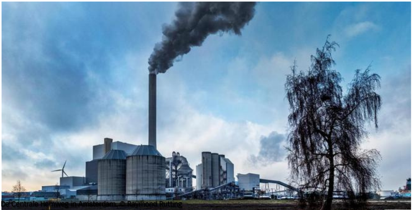
De Centrale Heinweg in Amsterdam.