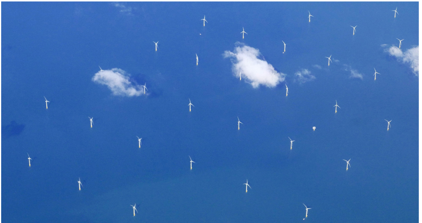
Een windmolenpark vanuit de lucht gezien in de Noordzee tussen Nederland en Engeland.

H et Nederlandse klimaatdebat beleefde de afgelopen tijd een orgie van eensgezindheid. Vóór de verkiezingen publiceerden alle politieke jongerenorganisaties een manifest voor snelle klimaatactie. Een groep multinationals waaronder Shell vroeg tijdens de campagne meer aandacht voor het klimaat. Na de verkiezingen ging het pas echt goed los: