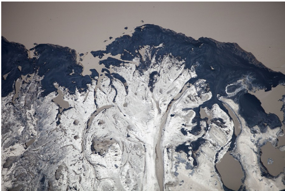
Een residubekken van de Syncrude mijn ten noorden van Fort McMurray in Alberta (Canada).

'What is this!?' briest hij tegen zijn makelaar, die het had moeten regelen. 'Why don't I own this!?! WHY DON'T I OWN THIS!!!' Plainview belichaamt de mentaliteit van het fossiele kapitalisme: dat het allemaal niet opkan, dat we altijd nog de teerzanden in Canada kunnen ontginnen. Blokkades voor nieuwe projecten zijn een manier om deze mentaliteit te breken, betoogt Klein.