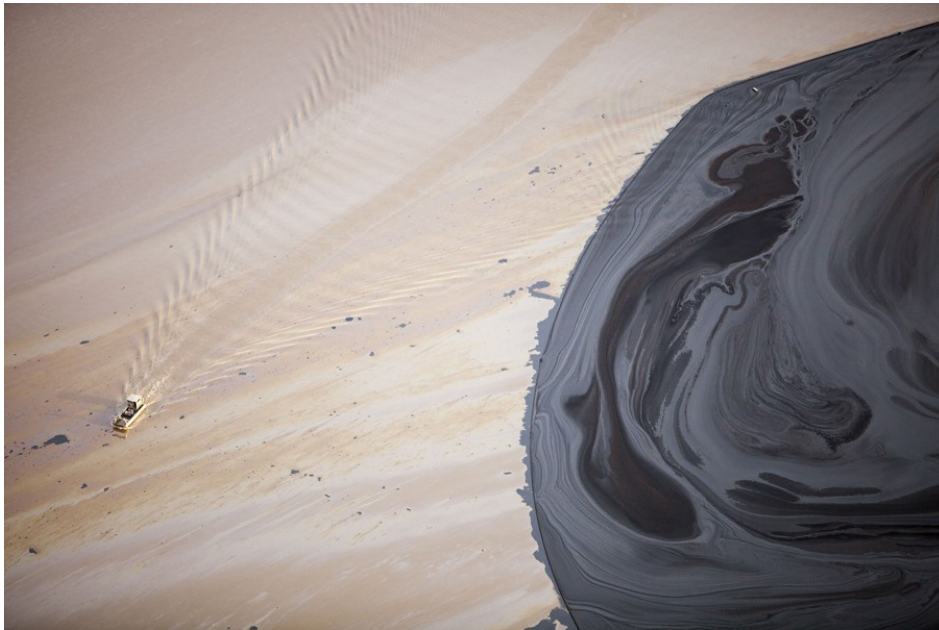
Een residubekken van de Syncrude mijn ten noorden van Fort McMurray in Alberta (Canada).