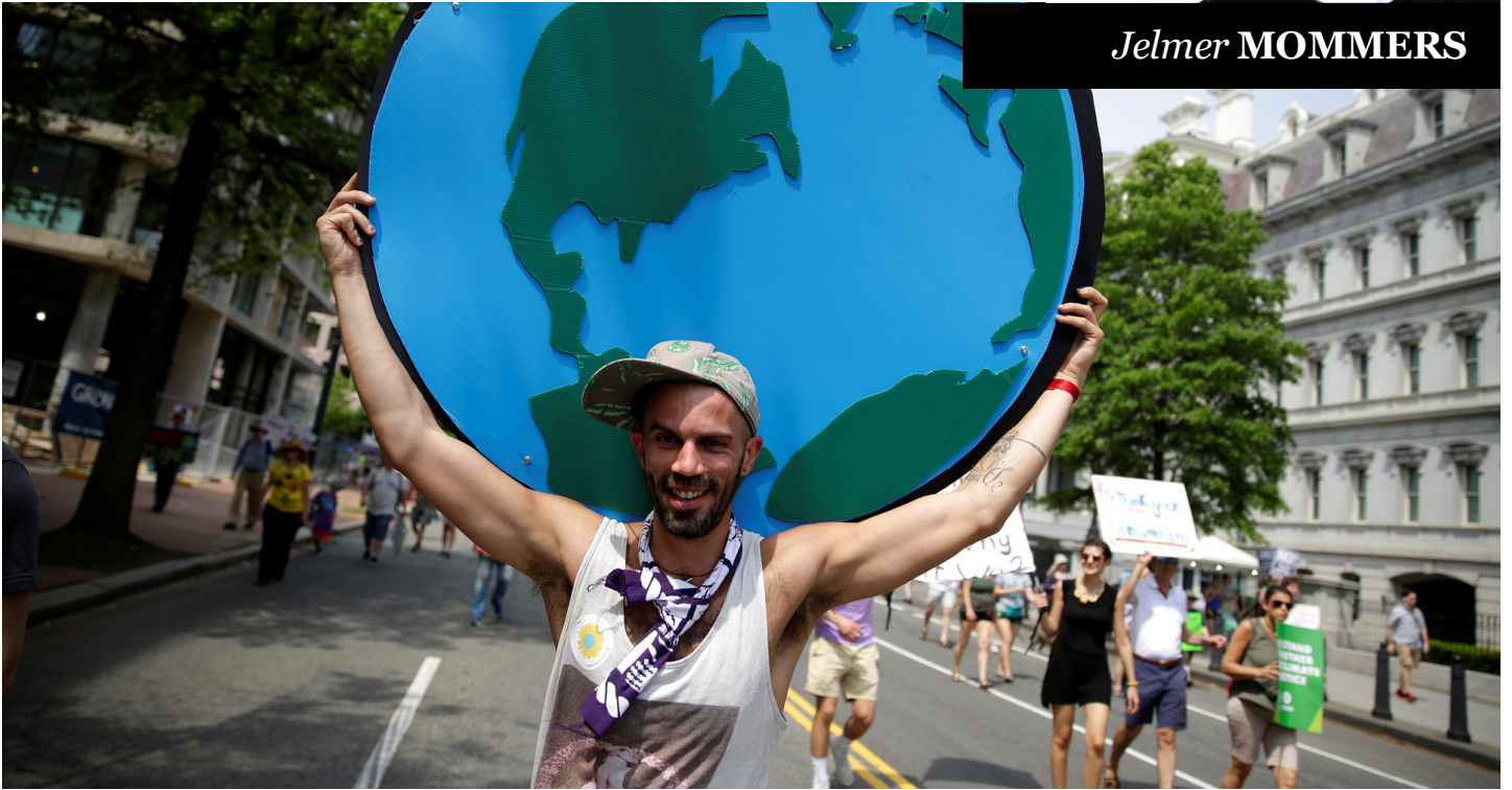
De Peoples Climate March in Washington op 29 april 2017.

D e komende minuten ga ik je overtuigen om mee te doen aan een actie die donderdag begint, genaamd Overstap10daagse . Of ja, ik ga mijn best doen.