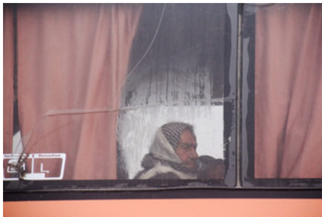
Syriërs zitten aan boord van een bus die vanuit Fuaa en Kafraya mensen naar Rashidin evacueert op 14 april, 2017.

Met zo'n verstrengeling van economische belangen, lokale machtsmotieven en de gewapende strijd is het erg moeilijk een politieke oplossing te vinden voor het conflict. En is het heel moeilijk om een normale economie op te bouwen. Een terugkeer naar de 'normale' economie van voor 2011 is problematisch, want de ongelijkheid was een van de oorzaken van de Arabische lente. Er moet een alternatief komen voor deze oorlogseconomie. Maar dat is duur.