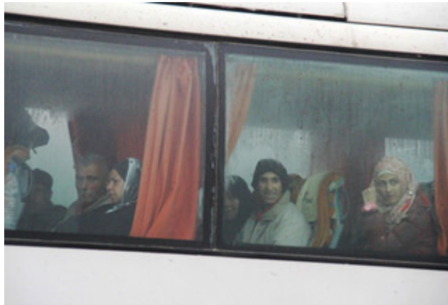
Syriërs zitten aan boord van een bus die vanuit Fuaa en Kafraya mensen naar Rashidin evacueert op 14 april, 2017.

diplomaten, militairen en hulpverleners om grip te krijgen op dit conflict. Het land is een speelbal geworden in een geopolitieke machtsstrijd. Van Veen: 'De zuurstof voor het conflict komt sinds enige tijd vooral van buiten. Daarom zal op dit moment een mogelijke oplossing eerst internationaal moeten worden gevonden. Wat de Syriërs zelf willen, is tragisch genoeg, van ondergeschikt belang geworden.'