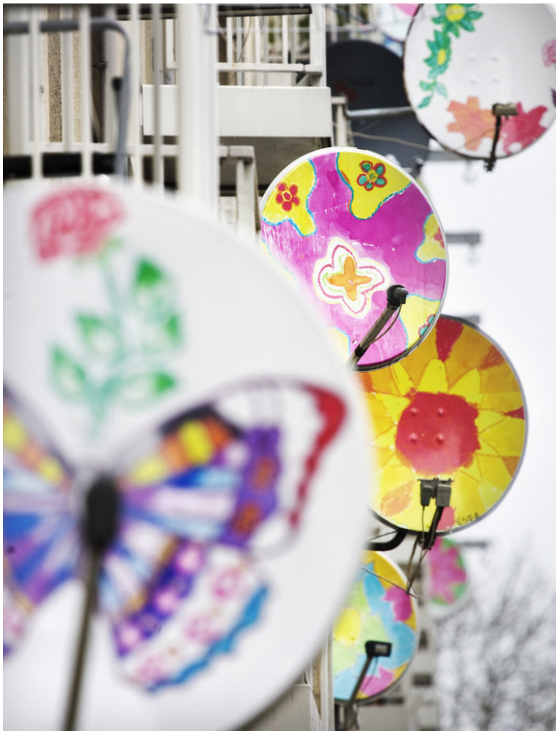
Fleurige satellietschotels in de Amsterdamse Kolenkitwijk (stadsdeel Bos en Lommer).

Dit onderscheid lijkt mij geforceerd. Om nieuwkomers op een goede wijze in een samenleving op te nemen, heb je niet alleen voorzieningen, scholing en opvang nodig, maar ook acceptatie en begrip op menselijk niveau. Integratie moet in de privésfeer goed verlopen, wil die ook in publieke samenhang slagen. Gebrek aan sociale betrokkenheid draagt uiteindelijk bij aan hoge kosten van deze groep.