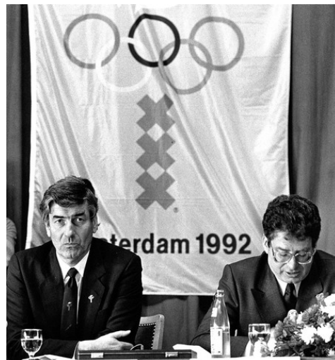
16 oktober 1986: Premier Ruud Lubbers en burgemeester Ed van Thijn op een persconferentie.