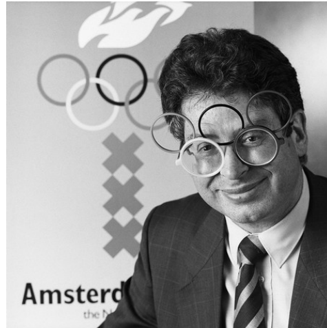
Ed van Thijn met een Olympische bril (1986).

burgemeester Ed van Thijn lobbyet tijdens de IOC-vergadering in de Zwitserse stad Lausanne.