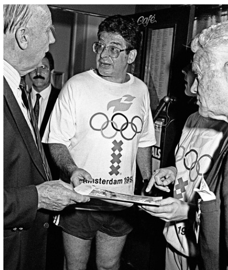
1 oktober 1986: De Amsterdamse

Zeventien jaar na de Volkskrant heb ik dat archief opnieuw bekeken om erachter te komen hoe het IOC in die tijd functioneerde. Het is een goudmijn, vooral de mappen met informatie over alle ruim negentig afzonderlijke IOC-leden. Die stukken - ruim 3.200 pagina's - zijn gebaseerd op gesprekken en informatie van Nederlandse