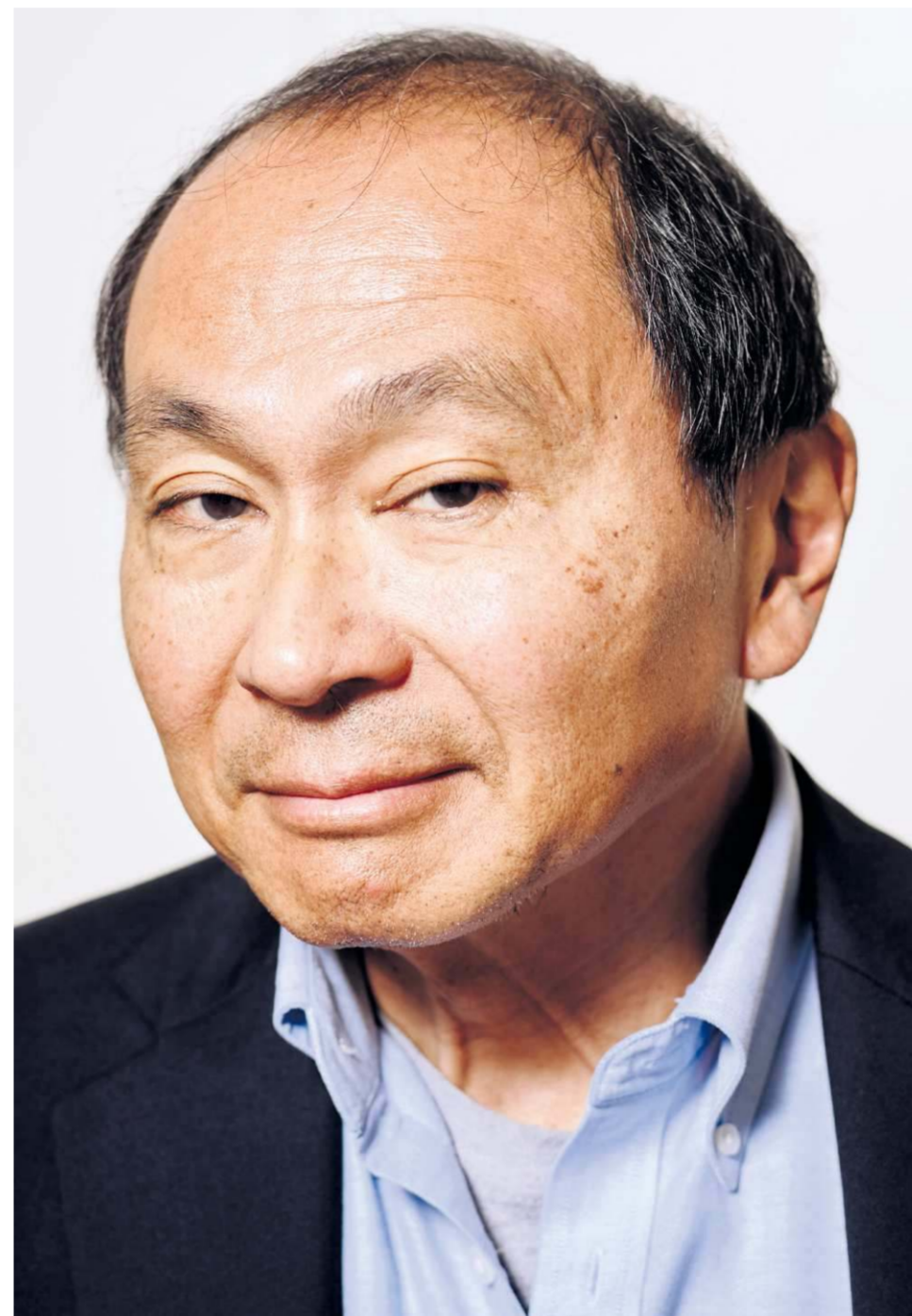
Francis Fukuyama: 'Het Midden-Oosten gaat een lange periode van bloedvergieten tegemoet'

„Niet veel goeds. Het Chinese perspectief is dat ze na honderd jaar vernedering terug zijn op het wereldtoneel. En ze willen dat dat erkend wordt. Al het sabelgekletter rond die eilandjes in de Zuid-Chinese Zee gaat in feite daarover en niet over de grondstoffen die daar liggen. Dat baart me echt zorgen. Er hangt veel af van wat de middenklasse in China gaat doen. Dat blijft de avant-garde van sociale en politieke verandering. Nu is die zo'n 400 miljoen mensen groot en dat is nog een minderheid. In die omstandigheden kiest de middenklasse vaak de kant van