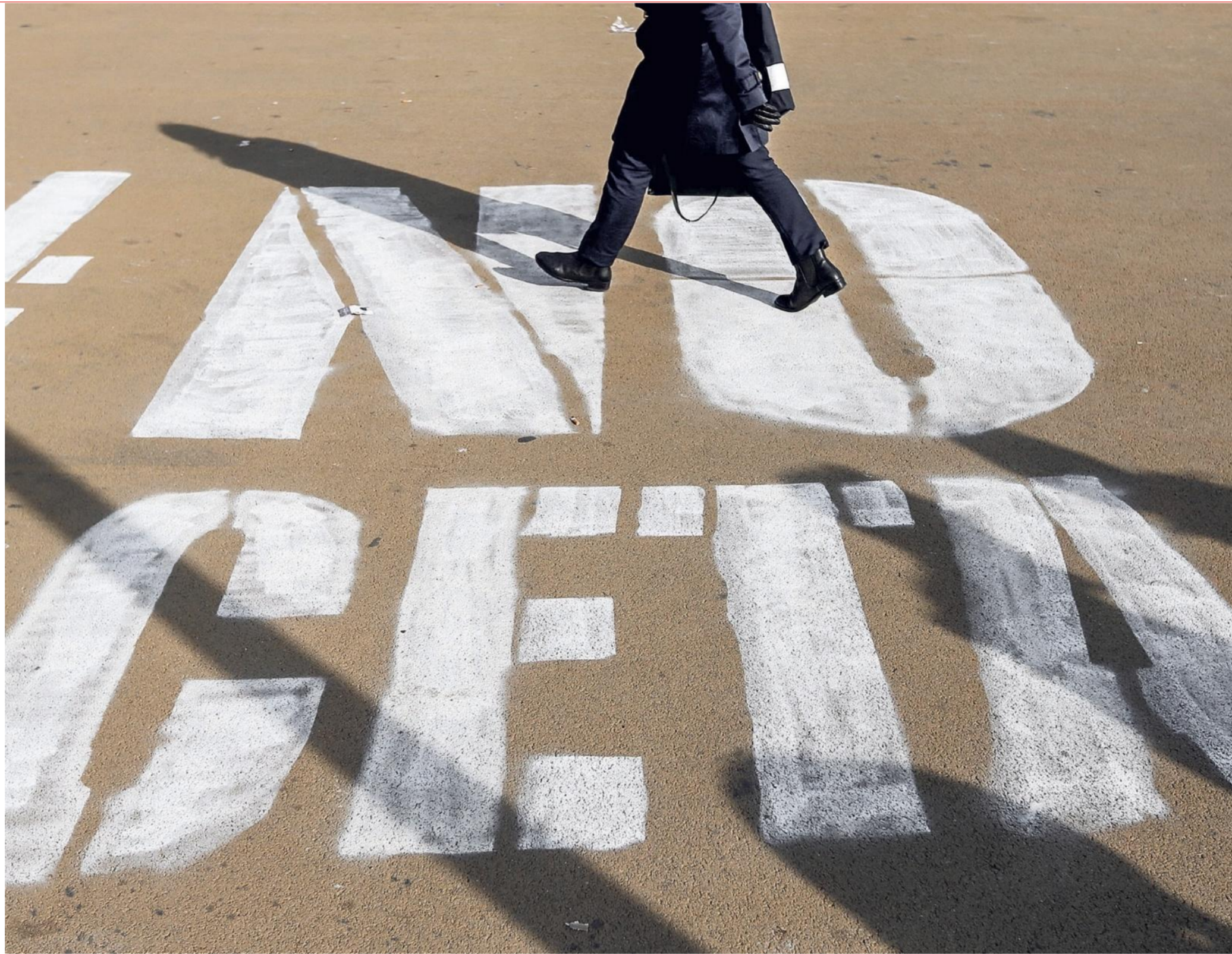
Graffitioprotest in Brussel tegen vrijhandelsverdrag CETA.

Investeringsbescherming is een zeer omstredden fenomeen, ook Wereldhandelsorganisatie WTO is er kritisch over. Het voornaamste bezwaar is dat het zou leiden tot 'regulatory chill' - staten zouden door de claimcultuur afzien van beslissingen die mogelijk wel in het belang